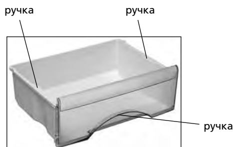
Рисунок 3 – Корзина

1.7 Холодильник должен эксплуатироваться в диапазоне температур окружающей среды, который соответствует климатическому классу (см. таблицу 1). Климатический класс холодильника указан на его табличке.